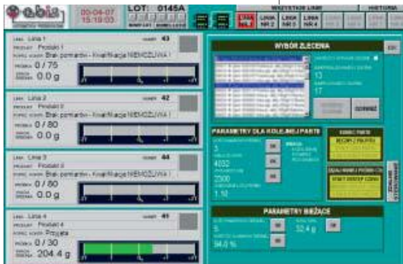
Rys. 2. Ekran konfiguracji linii.

W dniu 1 stycznia 2003 roku weszła w życie ustawa o towarach paczkowanych zwana popularnie ustawą o "e". Dotyczy ona przedsiębiorstw z branży spożywczej, kosmetycznej, chemicznej oraz częściowo farmaceutycznej. Znak "e" umieszczany jest na wyrobach firm, które stosują kontrolę masy i objętości swoich produktów oraz prowadzą określone w ustawie procedury kontrolne.