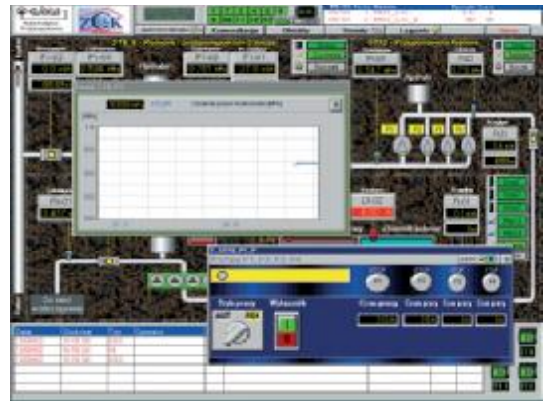
Rys. 2. Okno wizualizacji pracy przepompowni.

Dane zbierane przez sterowniki GE Fanuc, zainstalowane w obiektach, są przesyłane drogą radiową, za pomocą radiomodemów Sateline-3AS do komputera w stacji dyspozytorskiej, gdzie są gromadzone i analizowane z wykorzystaniem trendów historycznych. Dane te służą do podglądu zmian parametrów