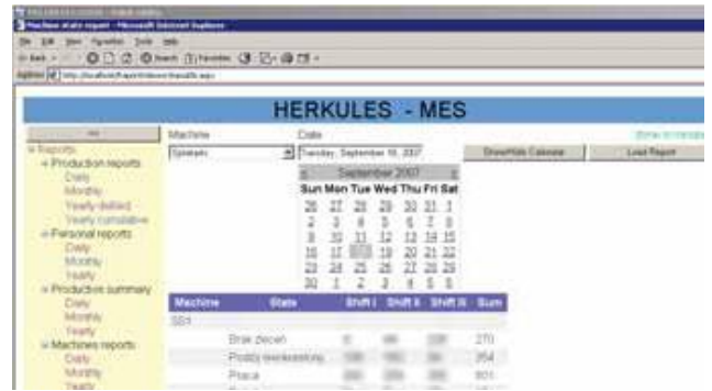
Wygląd przykładowego raportu.

Zorganizowanie przepływu informacji z poszczególnych gniazd produkcyjnych do średniego szczebla zarządzania oraz służb utrzymania ruchu i innych systemów informatycznych, napotyka na szereg zagadnień organizacyjnych. Bezpośrednie zastosowanie komputerów na produkcji nie jest w wielu przypadkach możliwe ze względu na brak miejsca, nadmierne zaangażowanie czasu pracow-